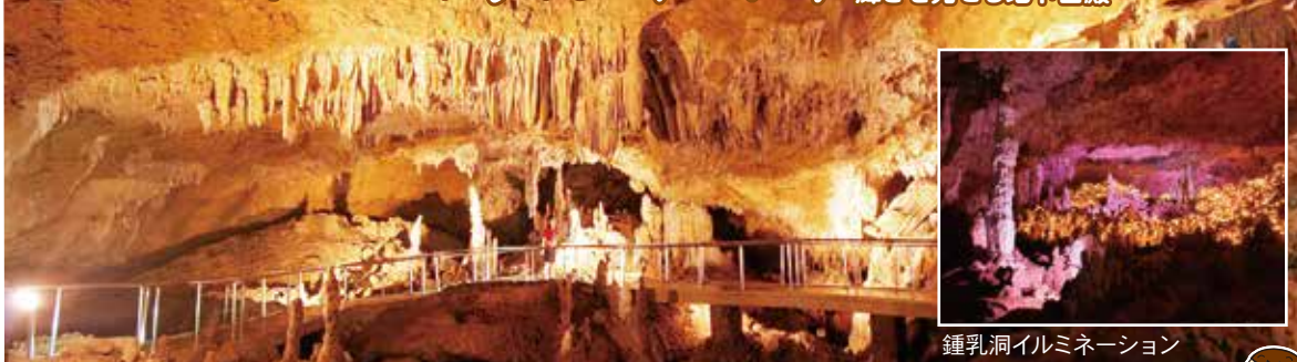
鍾乳洞イルミネーション

サンゴから生まれた石垣島の鍾乳洞は 美しい鍾乳石に彩られた神秘的な 輝きを見せる地下宮殿