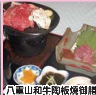
八重山和牛陶板燒御膳