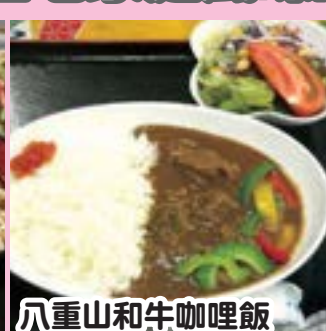
八重山和牛咖哩飯